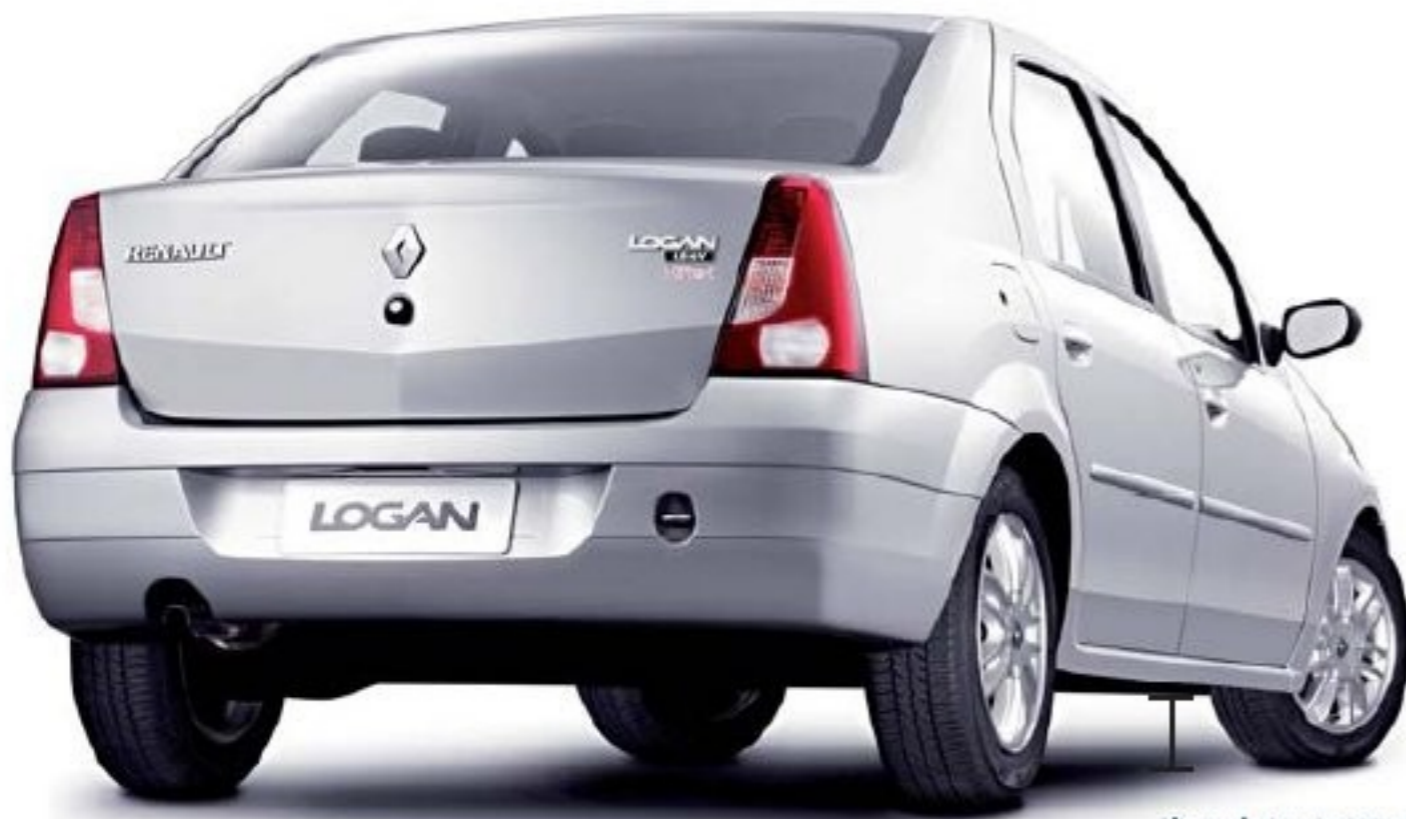
Altura al piso de 155 mm, superior dentro de su categoría