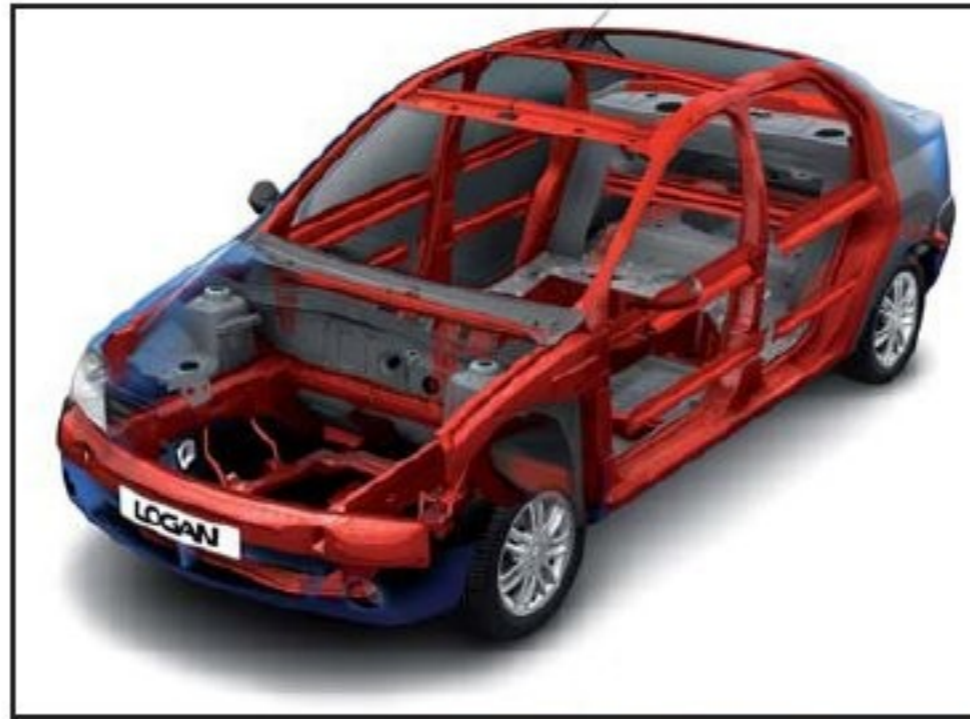
Chasis con zona de deformación programada